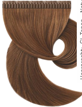
Haarpracht: „GL Tapes – Natural No. 31“ von Great Lengths, ab ca. 15 Euro pro Single-Tape, im Salon