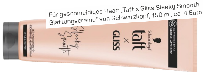
Für geschmeidiges Haar: „Taft x Gliss Slick Smooth Glättungscreme“ von Schwarzkopf, 150 ml, ca. 4 Euro