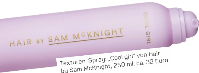
Texturen-Spray: „Cool girl“ von Hair by Sam McKnight, 250 ml, ca. 32 Euro