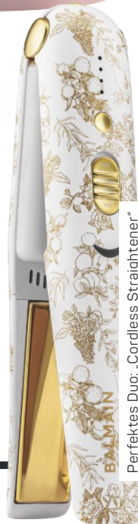
Perfektes Duo: „Cordless Straightener“ von Balmian Hair, ca. 290 Euro, limitiert