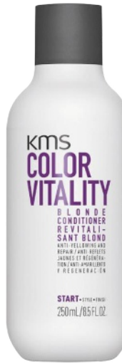
Langenhaltende Leuchtkraft: „Color Vitality Blond Conditioner“ von KMS, 250 ml, ca. 28 Euro