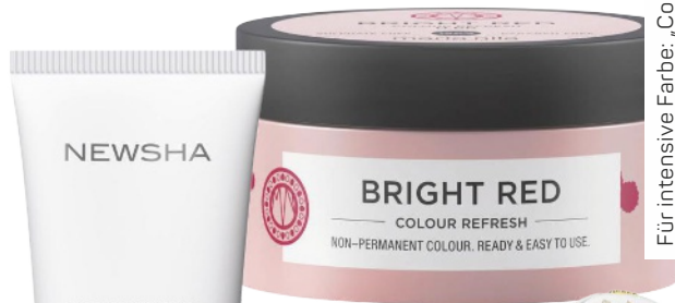
Kontrolliertes Haar: „Total Control Gel“ von Newsha, 125 ml, ca. 21 Euro