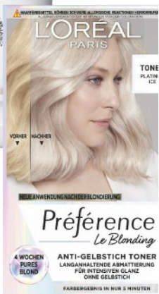
Anti-Gelbstich: „Le Bonding Toner – Platinum Ice“ von L'Oréal Paris, ca. 8 Euro