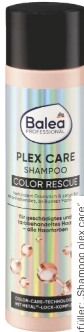
Lückentfüller: „Shampoo plex care“ von Balea, 250 ml, ca. 3 Euro