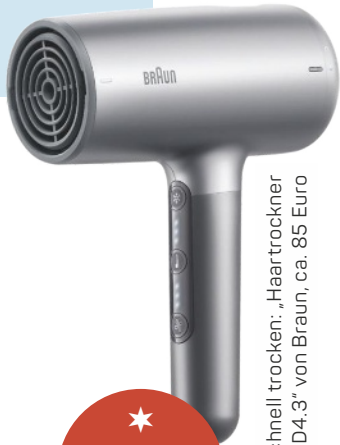
Schnell trocken: „Haartrockner HD4.3“ von Braun, ca. 85 Euro